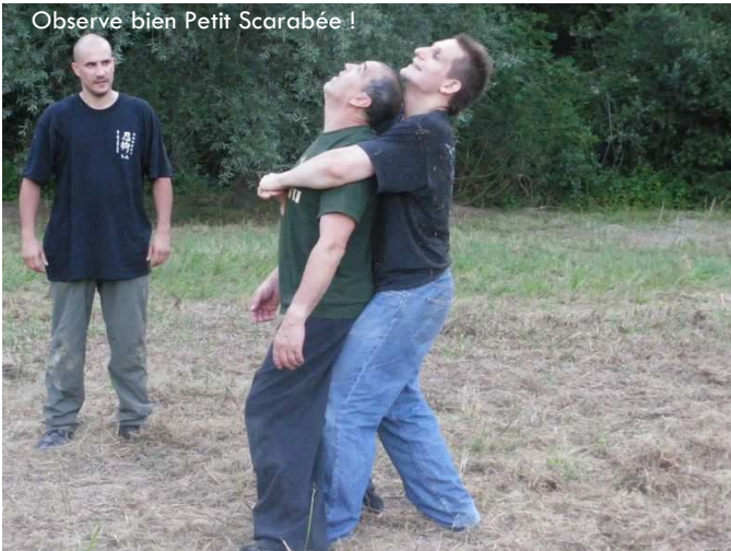
Observe bien Petit Scarabée !